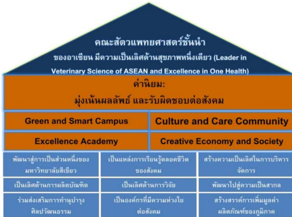
รูปที่ 2 แผนผังยุทธศาสตร์คณะสัตวแพทยศาสตร์