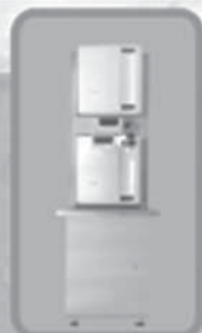
Water Purification System