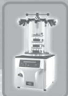
BenchTop Freeze Dryer