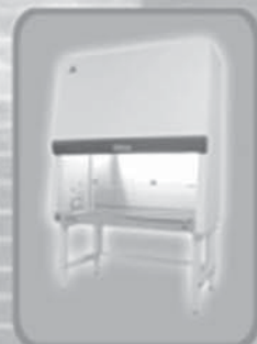
Biohazard Safety Cabinet Class II