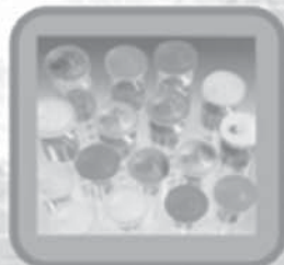
Filtration & Separation