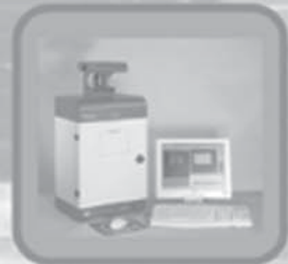
Gel Documentation and Image Analysis