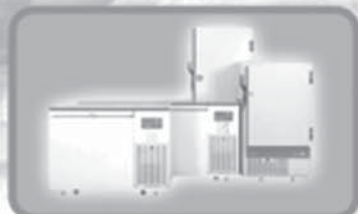
Refrigerators & Freezers