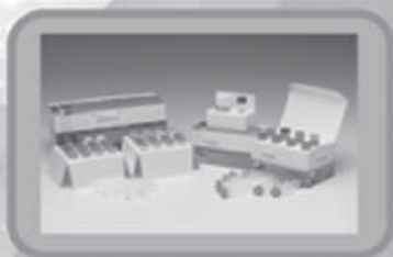
Cloning & Expression Kits