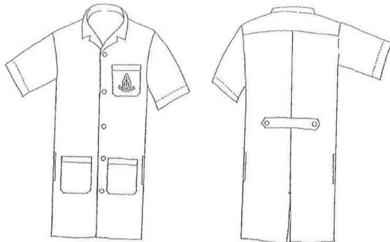
ภาพที่ 1 ด้านหน้า

ข้อ 6 เครื่องแบบสำหรับนักศึกษาในภาคปฏิบัติการ ระดับปรีคลินิก ให้สวมเสื้อกาวน์ยาวใช้เป็นเสื้อคลุม