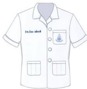
ภาพที่ 3 ด้านหน้า