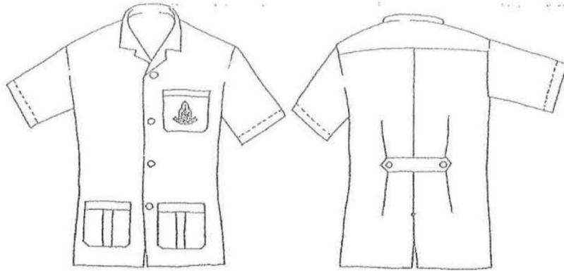
ภาพที่ 7 ด้านหน้า

ข้อ 8 เครื่องแบบสำหรับนักศึกษาใช้ปฏิบัติการภาคสนาม เป็นเสื้อทรงลำตัวสั้น และกางเกงขายาว