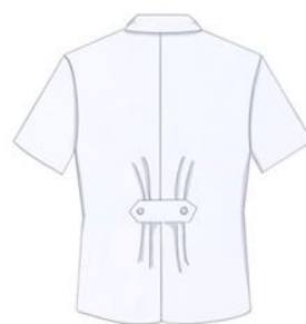
ภาพที่ 4 ด้านหลัง